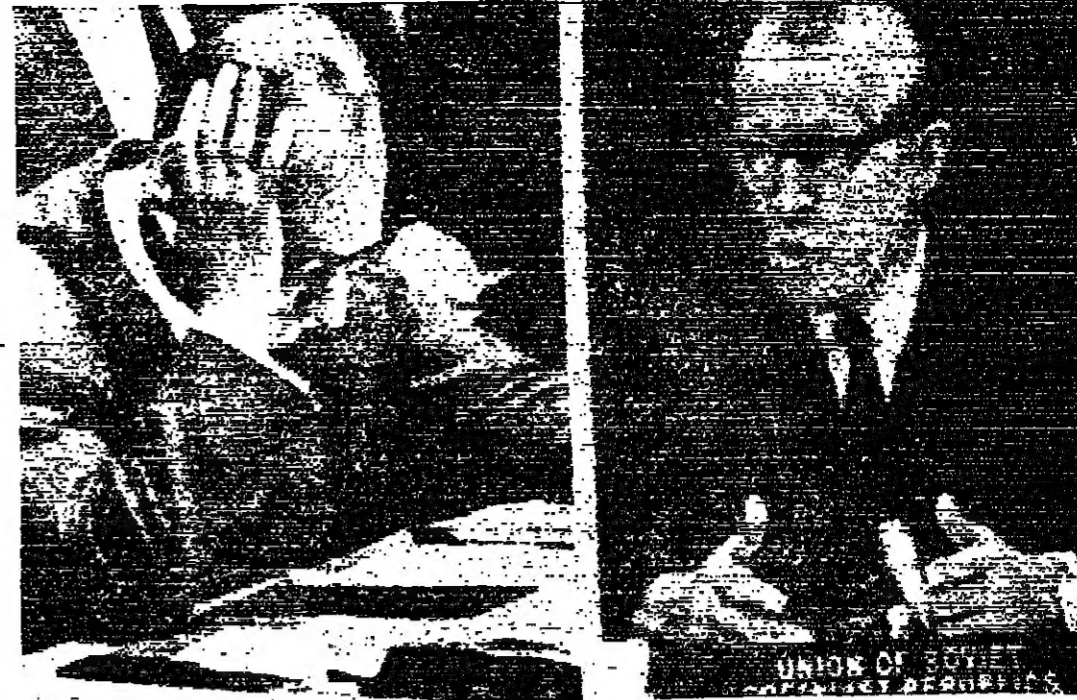
المستر جاكوب مالك مندوب الاتحاد السوفياتي، والمستر جيري هاجيك وزير خارجية تشيكوسلوفاكيا اتقاء مناقشة قضية تشيكوسلوفاكيا في مجلس الامن «صورة لاسلكية لليونانديتريس خاصة بالمستور»